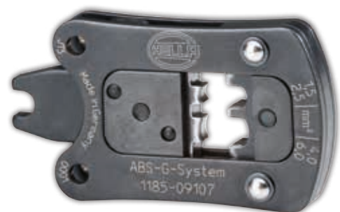
Gereedschapskop ABS-G Bestelnummer: 8PE 863 807-071