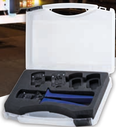
'Heavy Duty' gereedschapskoffer Mogelijke samenstelling