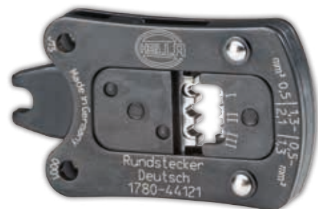
Gereedschapskop Deutsch DT Bestelnummer: 8PE 863 807-061

De gereedschapskop 'SUPERSEAL' biedt alle voordelen van het 'Heavy Duty' systeem. Bovendien is de kop aan de achterkant uitgerust met een geïntegreerde positioneringshulp die het duidelijk gemakkelijker maakt het contact op de juiste manier in het gereedschap te plaatsen. De speciale constructie maakt het daarbij mogelijk het krimpen en strippen geïntegreerd in één enkele handeling uit te voeren. Dat spaart waardevolle tijd.