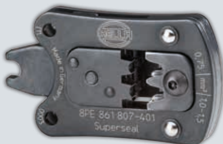
Gereedschapskop SUPERSEAL Bestelnummer: 8PE 863 807-401