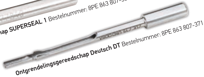
Ontgrendelingsgereedschap Deutsch DT Bestelnummer: 8PE 863 807-371

De gereedschapskop 'SUPERSEAL' biedt alle voordelen van het 'Heavy Duty' systeem. Bovendien is de kop aan de achterkant uitgerust met een geïntegreerde positioneringshulp die het duidelijk gemakkelijker maakt het contact op de juiste manier in het gereedschap te plaatsen. De speciale constructie maakt het daarbij mogelijk het krimpen en strippen geïntegreerd in één enkele handeling uit te voeren. Dat spaart waardevolle tijd.