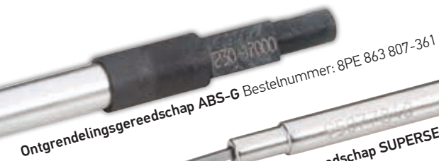
Ontgrendelingsgereedschap ABS-G Bestelnummer: 8PE 863 807-361