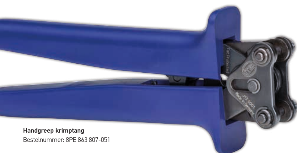
Handgreep krimptang Bestelnummer: 8PE 863 807-051