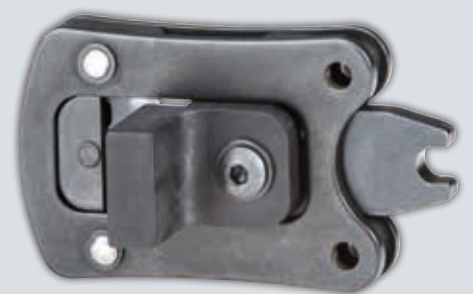
Gereedschapskop SUPERSEAL met geïntegreerde positioneringshulp