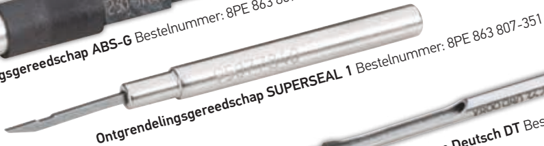
Ontgrendelingsgereedschap SUPERSEAL 1 Bestelnummer: 8PE 863 807-351