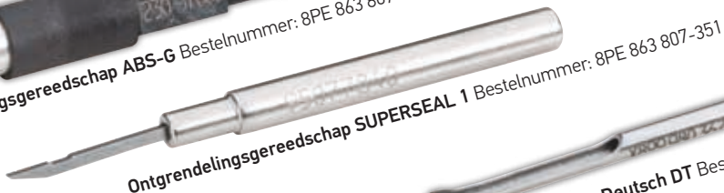
Ontgrendelingsgereedschap SUPERSEAL 1 Bestelnummer: 8PE 863 807-351