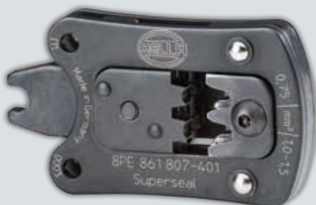
Gereedschapskop SUPERSEAL Bestelnummer: 8PE 863 807-401