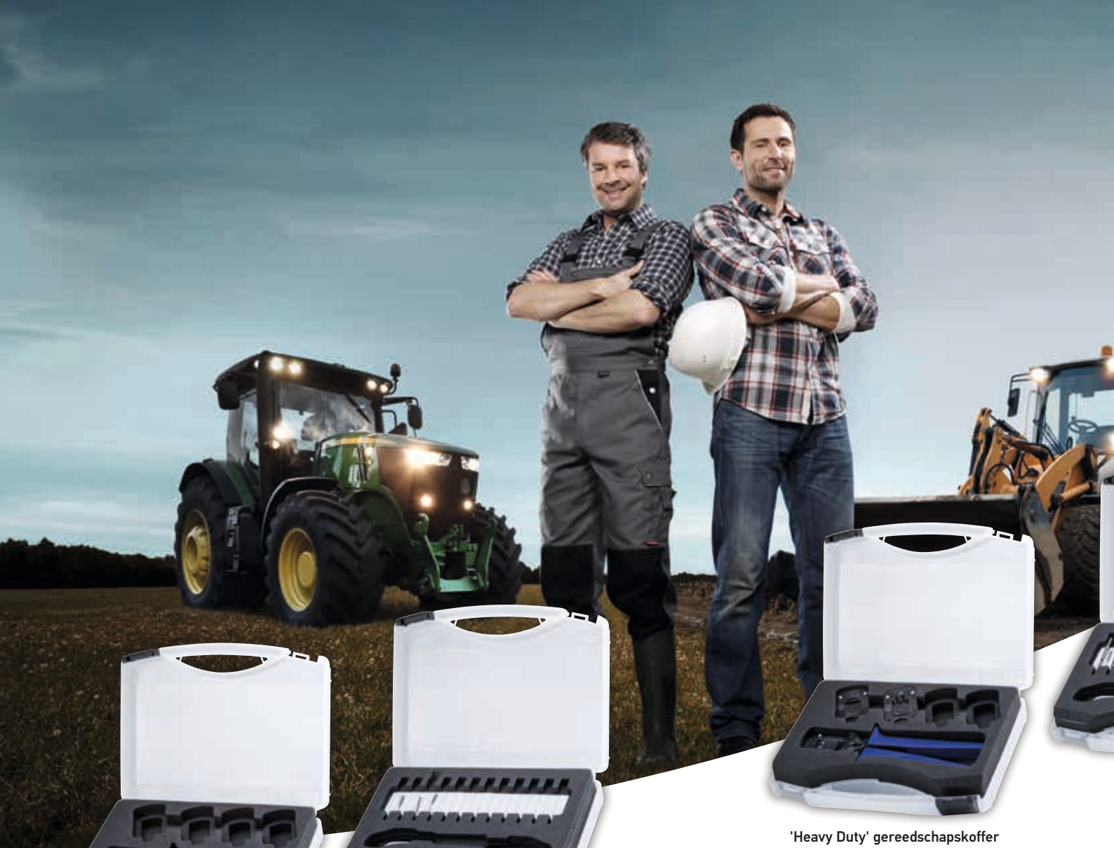
'Heavy Duty' gereedschapskoffer Mogelijke samenstelling

Het modulaire kofferconcept van het HELLA 'Heavy Duty' gereedschapssysteem maakt het mogelijk alle benodigdheden voor het krimpen en ontgrendelen netjes en overzichtelijk op te bergen. Aan de voorkant passen een complete tang (greep en kop) en maximaal vier extra gereedschapskoppen. Aan de achterkant is voldoende plaats voor verschillende soorten ontgrendelingsgereedschap met bijbehorende basisgreep.