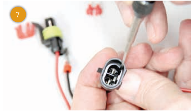
Ook hier moet u door ontgrendeling van het vergrendelingsnokje aan de contactpennen...