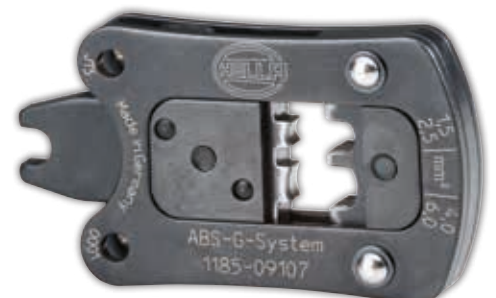
Gereedschapskop ABS-G Bestelnummer: 8PE 863 807-071