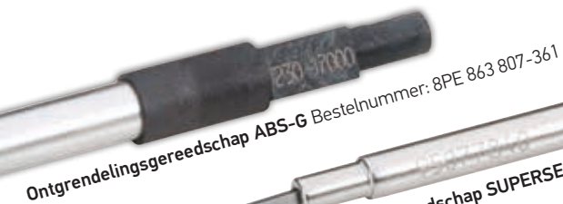
Ontgrendelingsgereedschap ABS-G Bestelnummer: 8PE 863 807-361