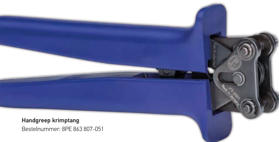
Handgreep krimptang Bestelnummer: 8PE 863 807-051