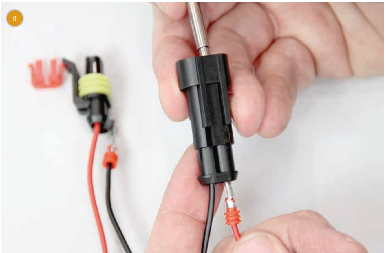
... de kabel naar achteren toe lostrekken uit de behuizing.

Scan de QR-code in en bekijk de handleiding als video: