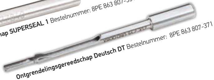
Ontgrendelingsgereedschap Deutsch DT Bestelnummer: 8PE 863 807-371

De gereedschapskop 'SUPERSEAL' biedt alle voordelen van het 'Heavy Duty' systeem. Bovendien is de kop aan de achterkant uitgerust met een geïntegreerde positioneringshulp die het duidelijk gemakkelijker maakt het contact op de juiste manier in het gereedschap te plaatsen. De speciale constructie maakt het daarbij mogelijk het krimpen en strippen geïntegreerd in één enkele handeling uit te voeren. Dat spaart waardevolle tijd.