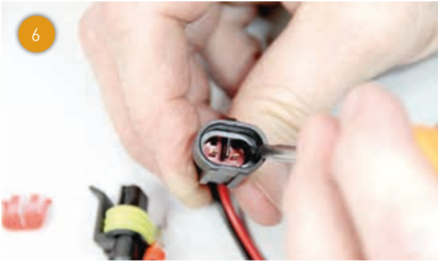
... de secundaire afdichting loswippen.