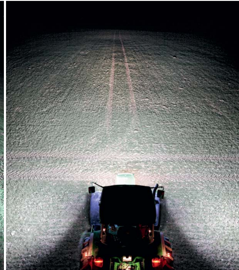
Aufrüstungsmöglichkeit 3: Die Zukunft 6 x LED-Arbeitsscheinwerfer

Belastung der Lichtmaschine: 16,48 Ampere