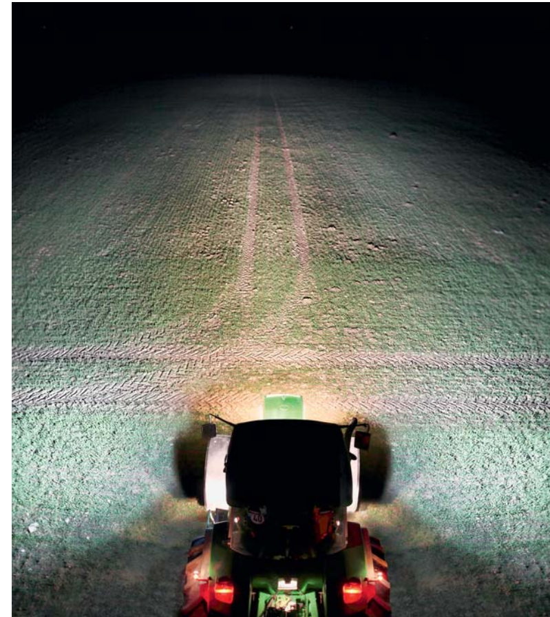
Aufrüstungsmöglichkeit 2: 2 x Halogen-Arbeitsscheinwerfer / 4 x LED-Arbeitsscheinwerfer

Belastung der Lichtmaschine: 21,98 Ampere