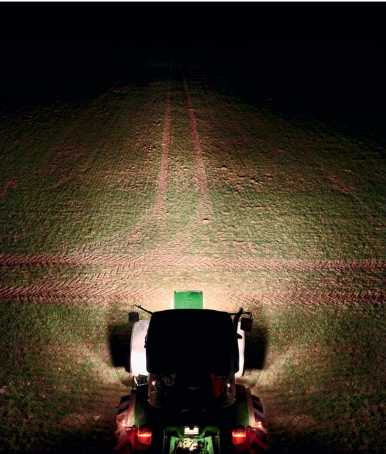
Die Gegenwart: 6 x Halogen-Arbeitsscheinwerfer

Belastung der Lichtmaschine: 27,48 Ampere