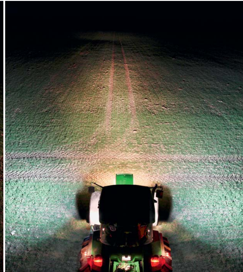
Aufrüstungsmöglichkeit 1: 4 x Halogen-Arbeitsscheinwerfer / 2 x LED-Arbeitsscheinwerfer

Belastung der Lichtmaschine: 27,48 Ampere